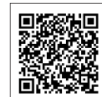
マイページQRコード